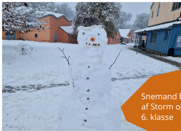
Snemand bygget af Storm og Thor 6. klasse

Sneen begyndte pludselig at dale ned i store fnug, og det trak straks i alle eleverne. De måtte simpelthen ud at lege i sneen, inden de satte sig i busserne med kurs mod Odense for at opleve teaterforestillingen Narnia.